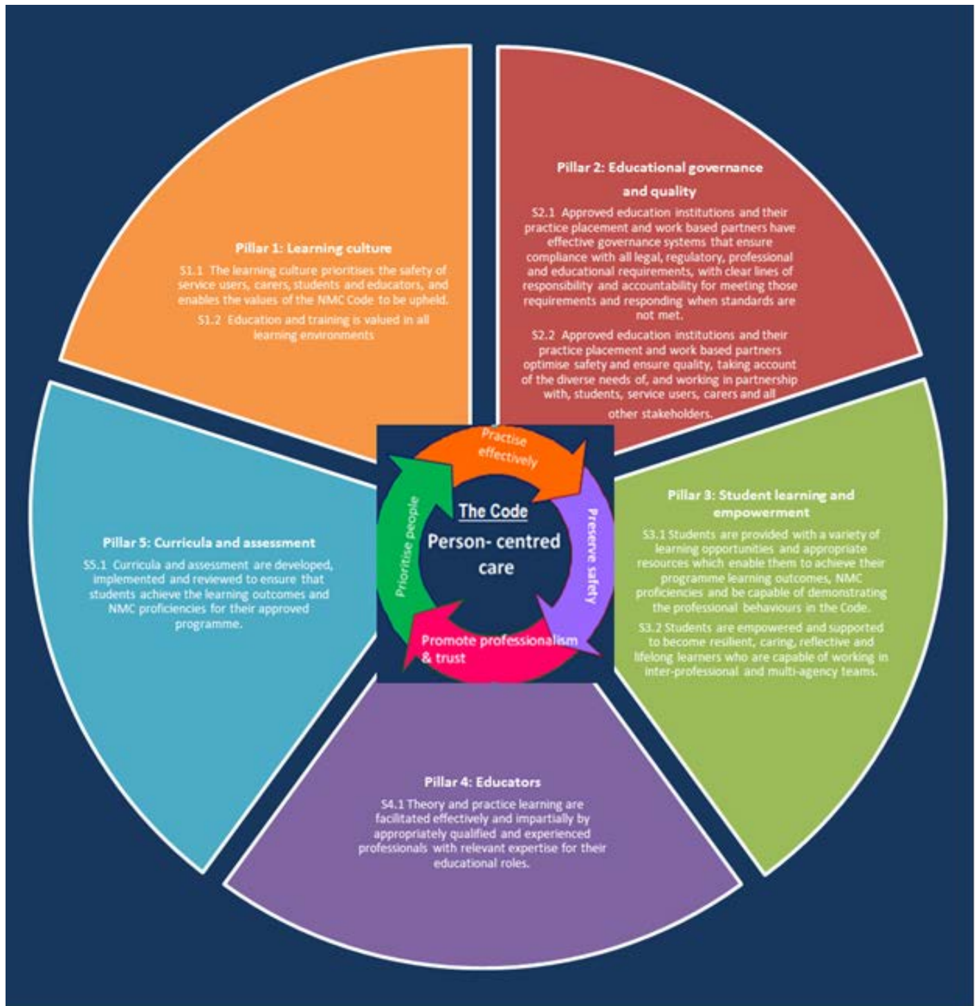
Diagram: Pum egwyddor ar gyfer addysg a hyfforddiant