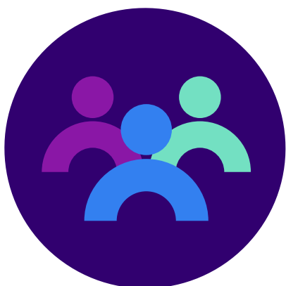
Grŵp llywio annibynnol

Mae cyd-gadeiryddion o'r grŵp cynghori cyhoeddus a'r grŵp cynghori myfyrwyr yn aelodau o'r grŵp llywio annibynnol.