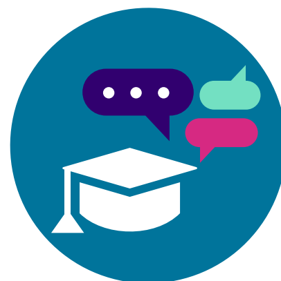
Grŵp cynghori myfyrwyr