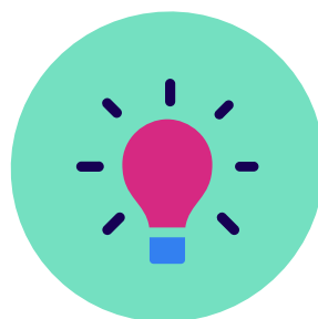
Agoredrwydd i ddysgu